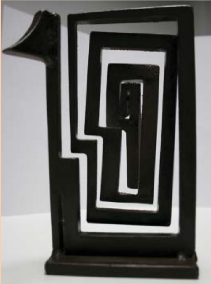
Maqueta de Denou , la escultura de Basset.