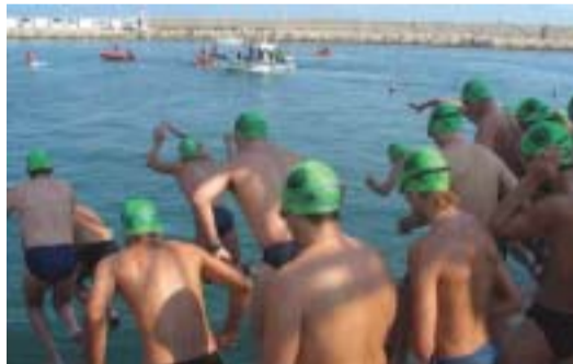
Los nadadores, en la edición pasada.

La travesía a nado del puerto de Gandia se realizó por primera vez en 1962 de forma discontinua y adoptó distintos nombres, como el de Copa Nadal o Travesía Reis. Desde 2002, la Travesía d'Hivern se viene celebrando sin interrupciones.