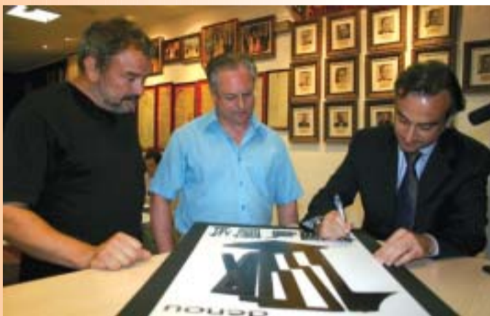
Hace un año, el gerente de Coesmi firmaba el proyecto de la escultura junto a su creador y al presidente de la JLF.