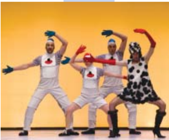
Un momento del espectáculo Laika , el pasado sábado.

Con esta representación concluirán dos semanas de teatro variado que ha llevado a escena a payasos, mimos, incluso espectáculos de danza. Asimismo, la víspera del seis de enero (Día de Reyes) acabarán la multitud de talleres diversos, cabalgatas y atracciones familiares que han desarrollado las diversas asociaciones de vecinos y comerciantes de los barrios de Gandia.