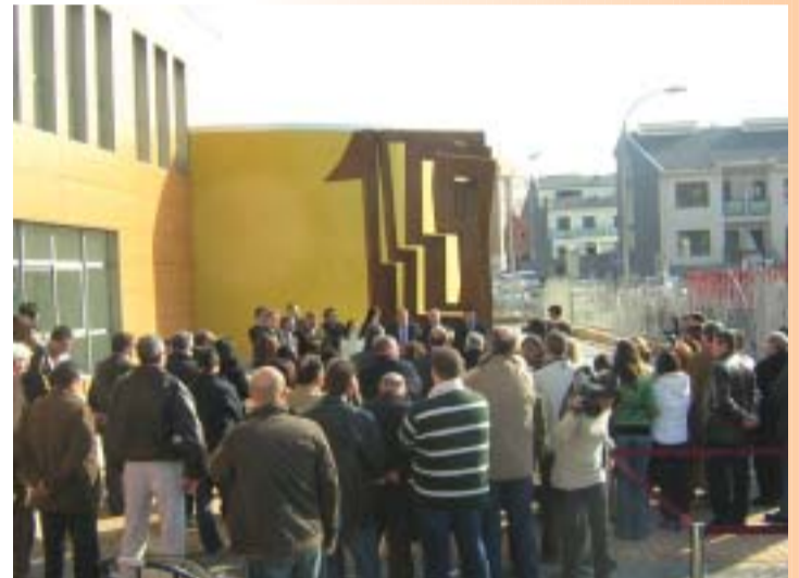
Vista panorámica de los asistentes a la inauguración de la escultura del Museu Faller de Gandia, el viernes.