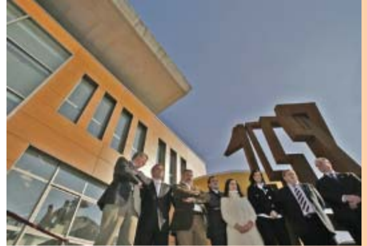
El gerente del grupo Coesmi, las falleras mayores, el alcalde de Gandia y el presidente de la JLF.