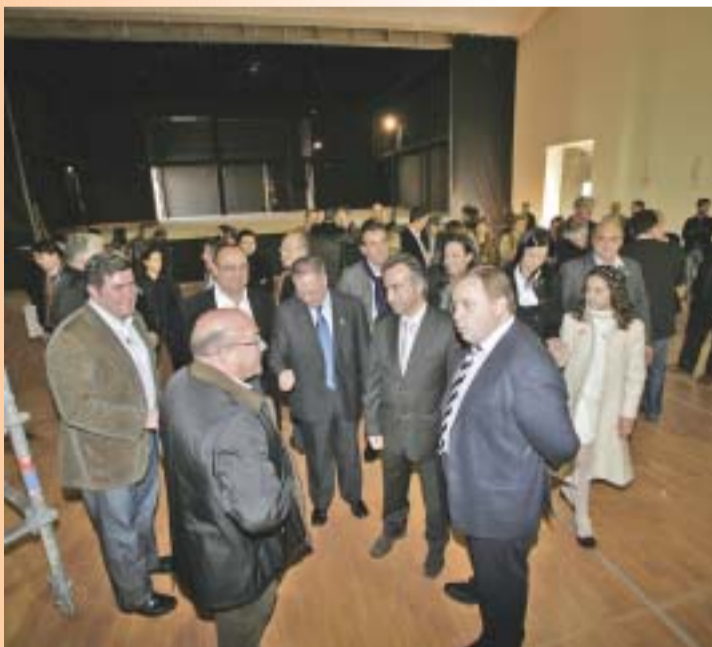
El alcalde de la ciudad presidió el recorrido por el Museu Faller en una jornada de puertas abiertas.